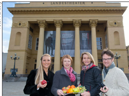
Das Tiroler Landestheater setzt auf Betriebliche Gesundheitsförderung.